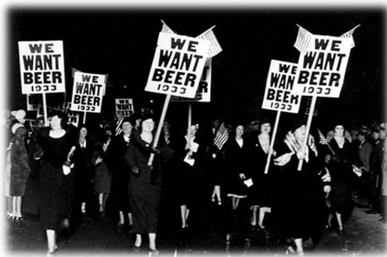
протест срещу забраната за консумация на алкохол, отбелязана е годината, в която се разрешава консумацията на алкохол в САЩ.

В света са налични редица примери за лошо регулиране и регулаторни провали, които внимателно следва да изследваме, за да се намали вероятността те да се възраздат и мултиплицират. Безспорно един от най-големите регулаторни провали е забраната за консумацията на алкохол в САЩ (1920-1933). Генералната идея за въвеждането на сухия режим е намаляване на престъпността, на нарушенията на обществения ред и корупцията, както и подобряване на здравния статус на нацията. Резултатът от инициативата е провал във всички области – престъпността става добре организирана, корупцията придобива застрашителни размери, закрива се бизнес, настъпва пик на сивата икономика, от което намаляват постъпленията в бюджета от данъци и такси, закриват се и работни места. Поради тези причини, а и поради липсата на здравен контрол върху качеството на алкохола, се нанасят редица щети върху човешкото здраве, респективно върху здравната система. Някои данни показват, че консумацията на алкохол намалява единствено в годината след реалното въвеждане на режима (1921) поради шока и все още неориентирания черен пазар, а впоследствие нараства многократно и никога не достига до нивата на годината преди забраната 1919 г. 5