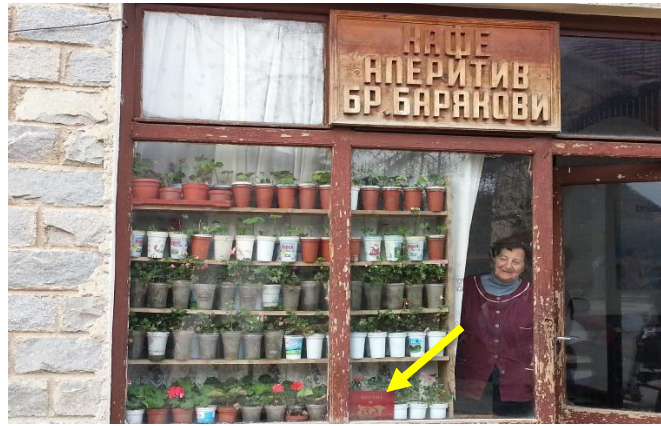
град Банско, 2013 г., със стрелка е посочено мястото на табелката за звездната категоризация на заведения - един от отживелите режими

Причината е огромната съпротивата срещу премахването на основни административни и регулаторни тежести. Развитието продължава да се блокира от бюрократи или определени групови интереси. Те пазят ревностно статуквото, тъй като облекчаването на режими води до загуба на власт и влияние.